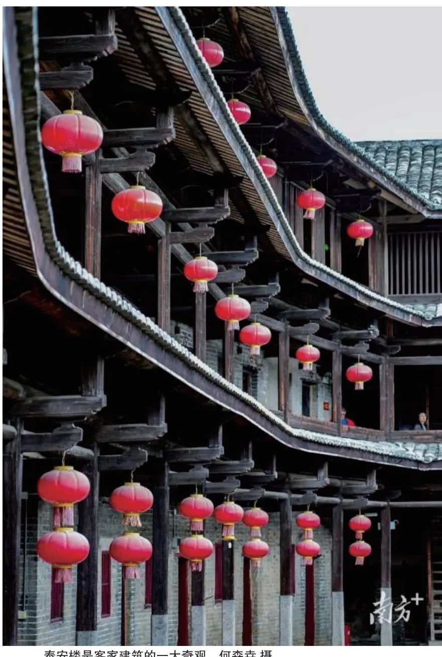
泰安樓是客家建築的一大奇觀。