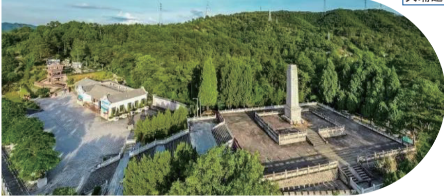
圖為三河壩戰役紀念園。