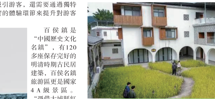
利用好美麗鄉村建設成效，大埔加快民宿產業發展，優化配套設施。