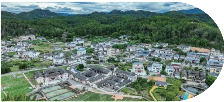
西河鎮北塘村利用古民居古建築發展文旅產業。