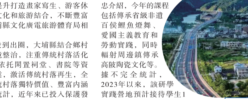
大埔逐步完善交通基礎建設，推進全域旅游。