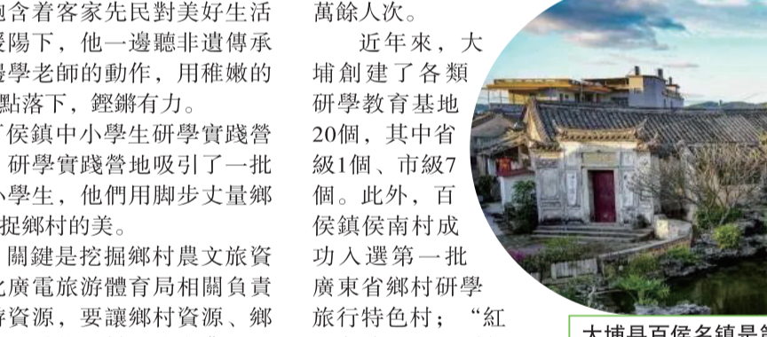
大埔縣百侯名鎮是第五批“中國歷史文化名鎮”，景區內有120多座保存完好的明清時期古民居建築。